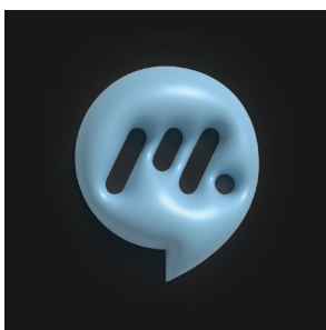
PRIMER: prilagojen logotip